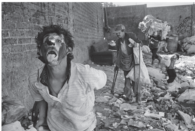
Basurero de Ciudad de Guatemala

Welcome to the Garbage Mountain es un proyecto personal del fotógrafo pamplonés Joseba Zabalza, quien ha recorrido vertederos y fotografiado las diversas realidades en torno a la actividad del reciclaje en cinco continentes. Comenzó en septiembre de 1999 con el reportaje del basurero central de la ciudad de Guatemala. Desde hace sesenta años, este basurero céntrico es escenario de una dinámica actividad, y motivo de continuas tensiones y