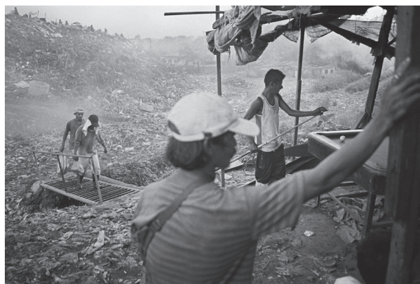
Basurero de Payatas, Metro Manila

enfrentamientos entre autoridades y pobladores por los incendios, plagas, alto índice de delincuencia, olores, etc.