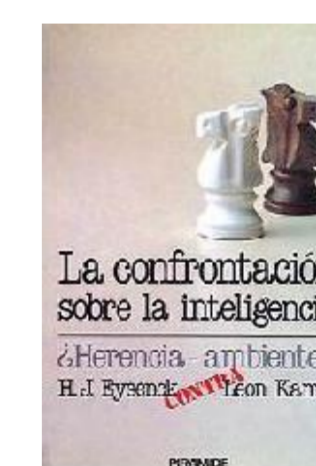
Confrontación sobre la inteligencia: ¿herencia-ambiente? Eysenck vs. Kamin

Ese mismo año, la teoría triárquica de la inteligencia , de Robert J. Sternberg , adopta un acercamiento más cognitivo. Propone tres tipos de inteligencia: analítica, creativa y práctica; cada uno conforma tres subteorías parciales que se complementan entre sí: componencial, experiencial y contextual.