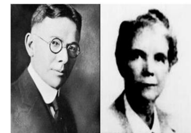
L.M. Terman y M. A. Merrill

En 1916, Lewis M. Terman lleva a cabo la revisión de la escala de Binet-Simon y elabora las escalas de inteligencia Stanford-Binet. Posteriormente, Terman publica una segunda revisión junto a su colega Maud A. Merrill que se convertirá en la Medida de la Inteligencia Terman-Merrill (1937).