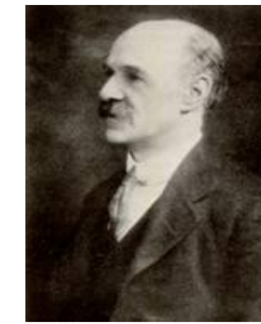
Ch. E. Spearman (1863-1945)

William Stern formula el concepto de coeficiente intelectual (C.I.).