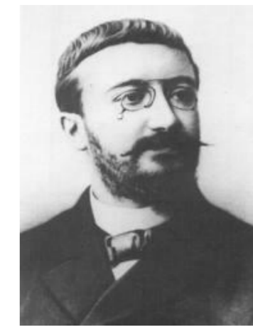
A. Binet (1857-1911)

En 1904 Charles E. Spearman expone la teoría bi-factorial : la inteligencia se compone de un factor general (factor g ) y otros específicos ( s ).