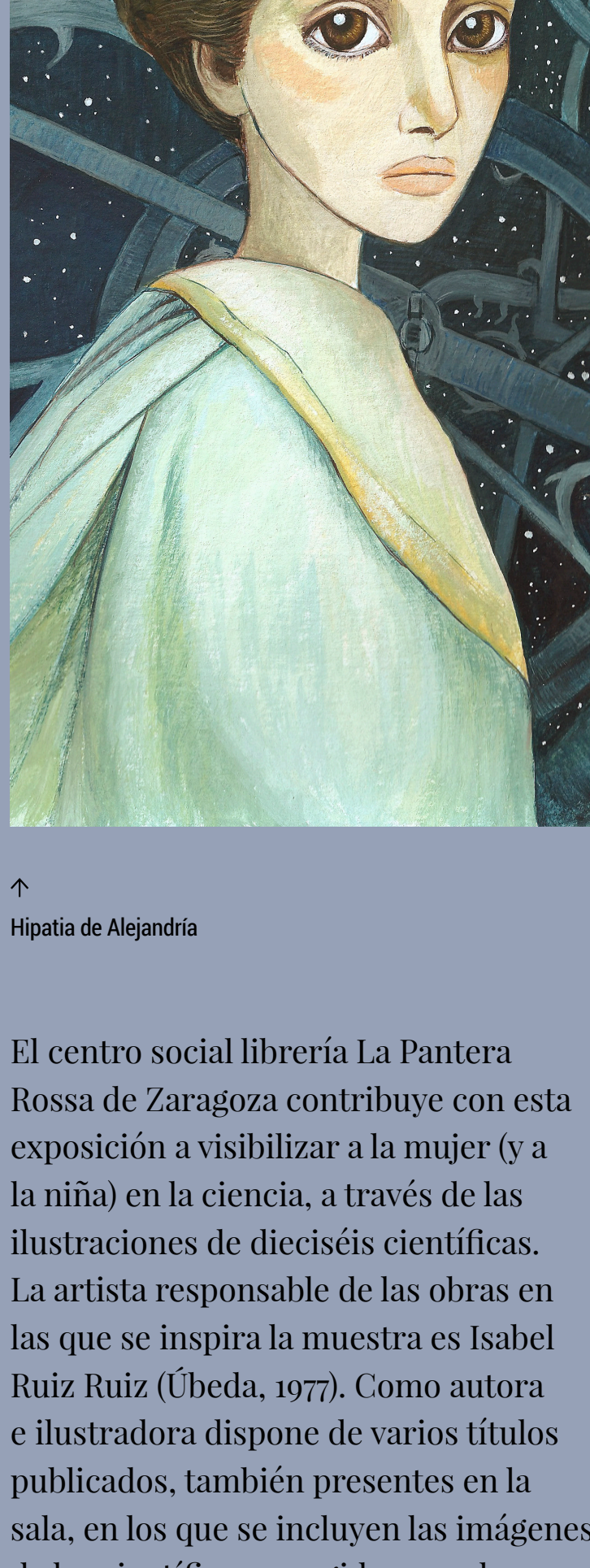
↑ Hipatia de Alejandría

El centro social librería La Pantera Rossa de Zaragoza contribuye con esta exposición a visibilizar a la mujer (y a la niña) en la ciencia, a través de las ilustraciones de dieciséis científicas. La artista responsable de las obras en las que se inspira la muestra es Isabel Ruiz Ruiz (Úbeda, 1977). Como autora e ilustradora dispone de varios títulos publicados, también presentes en la sala, en los que se incluyen las imágenes de las científicas escogidas para la exposición. El trabajo de Isabel en los últimos años ha estado centrado en dar visibilidad a la mujer, con el objetivo de rescatar a grandes mujeres del olvido. Sus ilustraciones nos pintan un mundo más equilibrado donde poder encontrar referentes femeninos, y en el que la historia también se cuenta con nombres de mujer.