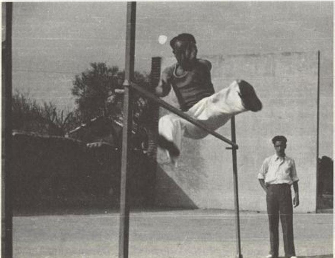
Fotografía tomada por Zúñiga de las actividades del Instituto Escuela.

Guillermo Fernández López Zúñiga nace en Cuenca el 27 de abril de 1909, licenciándose en Ciencias Naturales en la Universidad Central de Madrid en 1932. Ejerció de catedrático en el Instituto Escuela de Segunda Enseñanza de Madrid en 1933.