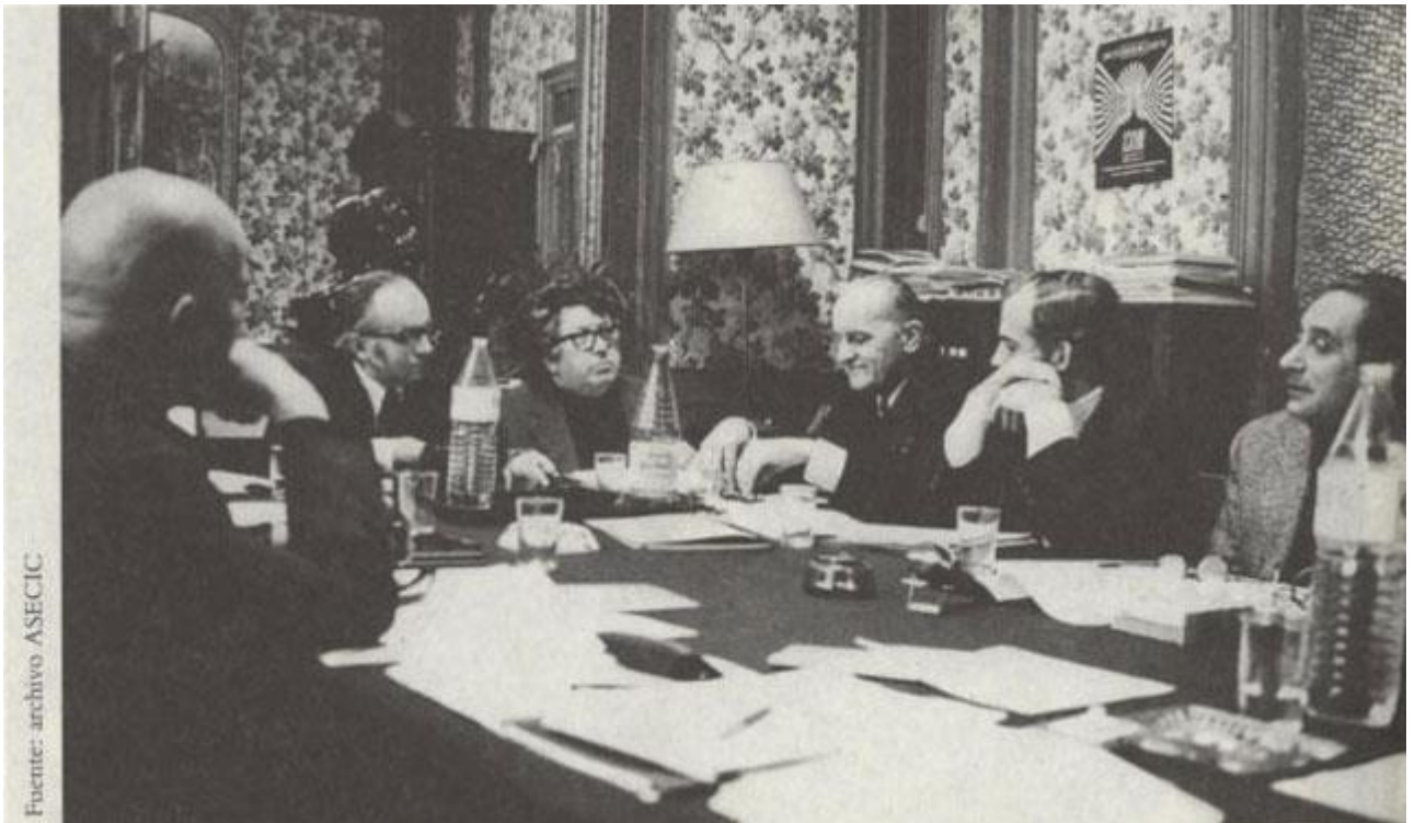
XXIX Congreso Internacional de la ISFA/AICS, celebrado en Eindhoven(Holanda), septiembre 1975.