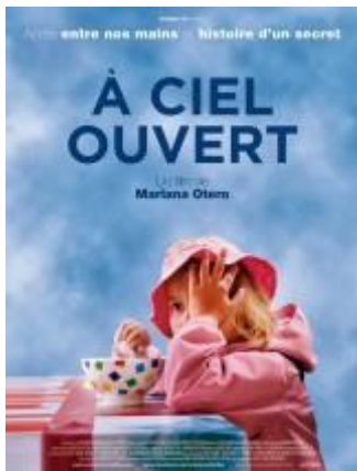
A cielo abierto

Recibió la Palma de Oro en el Festival de Cannes 2008 y representó a Francia en los Óscar.