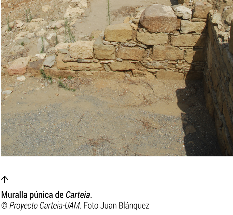
↑ Muralla púnica de Carteia .

Así, la ayuda dispensada por la empresa CEPSA, a través de su refinería Gibraltar-San Roque, no solo económica sino también en cuanto a infraestructura, en los siempre complicados «trabajos de campo», han constituido un factor fundamental a lo largo de los años. También el apoyo institucional del propio Ayuntamiento de San Roque (Cádiz), término municipal este en donde se ubica Carteia , a lo largo sucesivos consistorios e, independientemente, de la orientación política de los mismos. Por lo que respecta a las citadas «divulgación» y «transferencia», claramente diferenciables, los 18 cursos de verano llevados a cabo por la Universidad de Cádiz, en su sede sanroqueña, con el mecenazgo de CEPSA, o el proyecto museológico, museográfico y de dirección científica del actual Museo Municipal de San Roque.