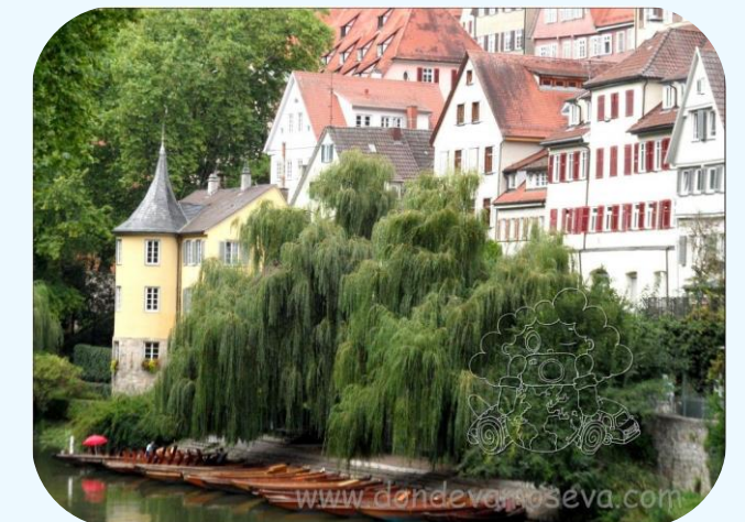
Torre de Hölderlin, cuna del romanticismo alemán