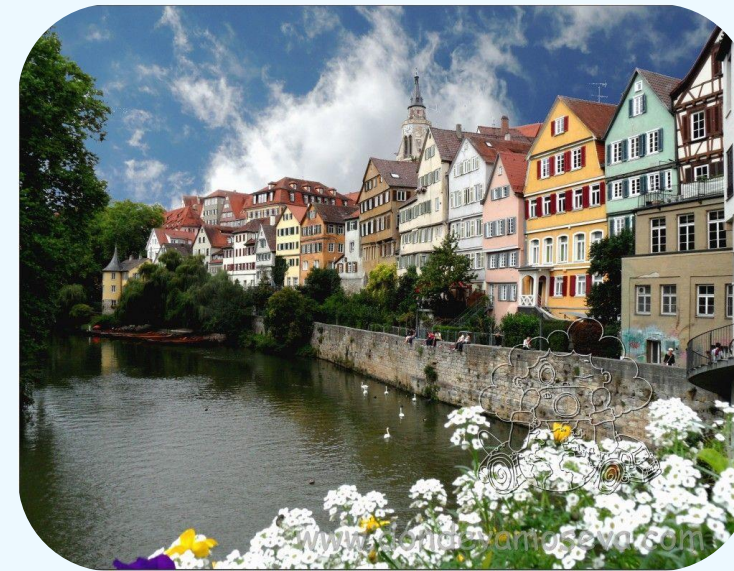
Zwingel frente al río Neckar