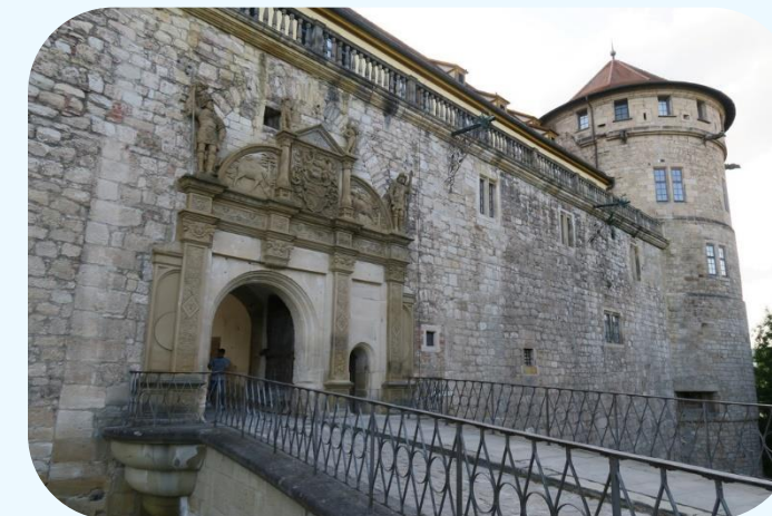
Castillo de Tübingen