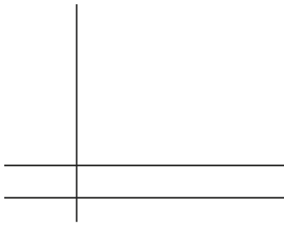
Orden y calma