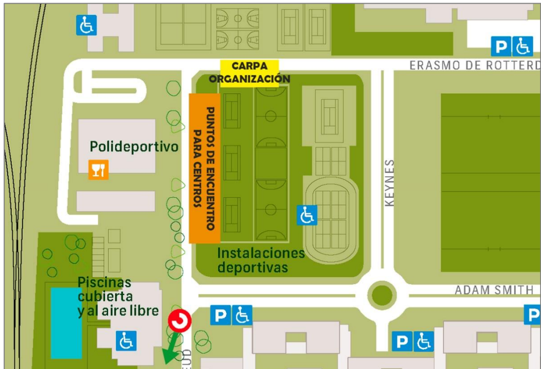
Mapa 2, instalaciones deportivas UAM.