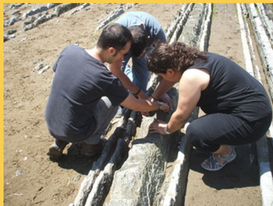
Foto: Un graduado con sordoceguera de la UAM con su mediadora y un geólogo ecaminando los estratos en el geoparque de la costa vasca.

A través de materiales como guías en Lectura Fácil, videos con interpretación en Lengua de Signos Española, materiales táctiles, adaptando contenidos científicos para la infancia o acudiendo a hospitales y prisiones para realizar talleres, la comunidad geológica trabaja para que la accesibilidad plena a la ciencia sea una realidad.