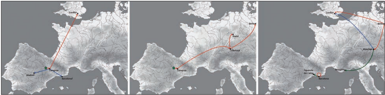
Fig. 4. Mapa de Europa con reconstrucción del periplo anticuario de los cascos de Aranda de Moncayo.