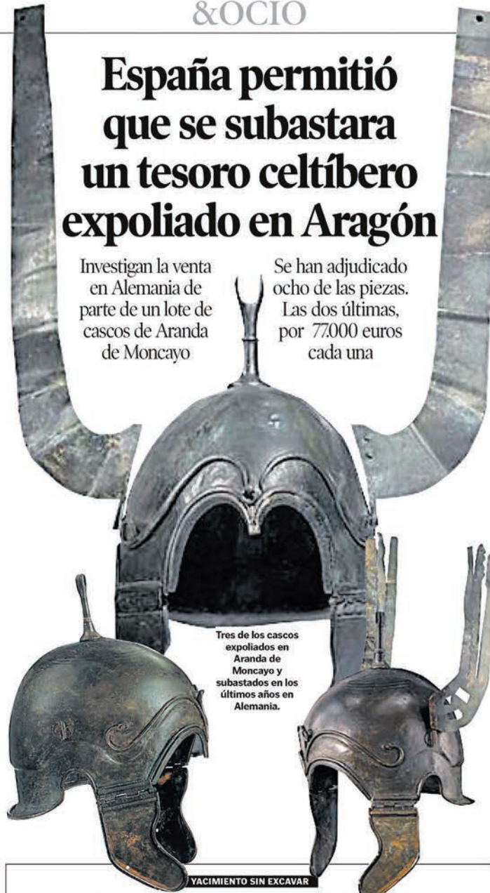
Tres de los cascos expoliados en Aranda de Moncayo y subastados en los últimos años en Alemania.

Este magnate alemán del sector de la construcción atesoró en vida la colección de armas antiguas más importante de la Historia. Un solo dato lo prueba: hasta ahora, y después de haberse excavado más de 10.000 tumbas, se conocen