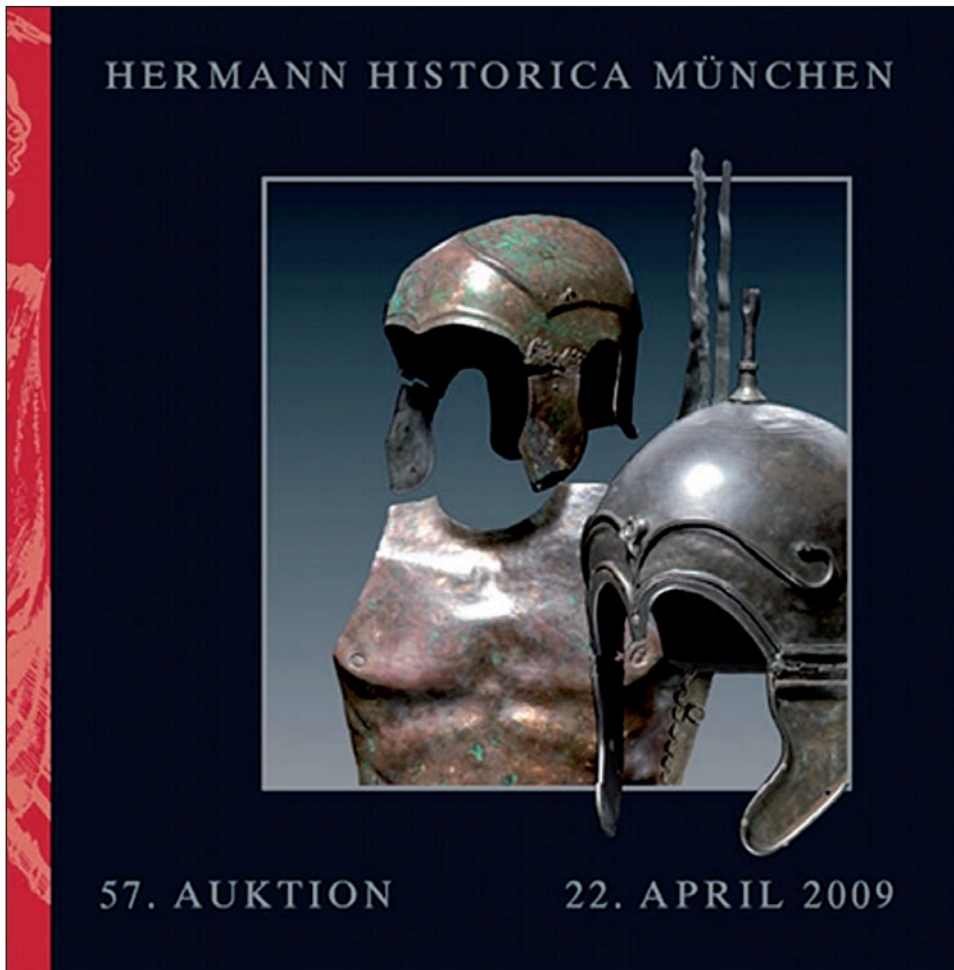
Fig. 2. Portada de catálogo de Hermann Historica con casco de Aranda de Moncayo (22 de abril de 2009).