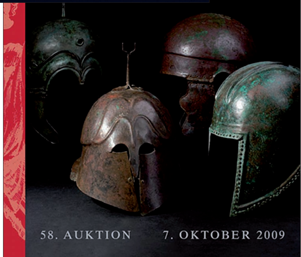
Fig. 3. Portada de catálogo de Hermann Historica con casco de Aranda de Moncayo (7 de octubre de 2009).