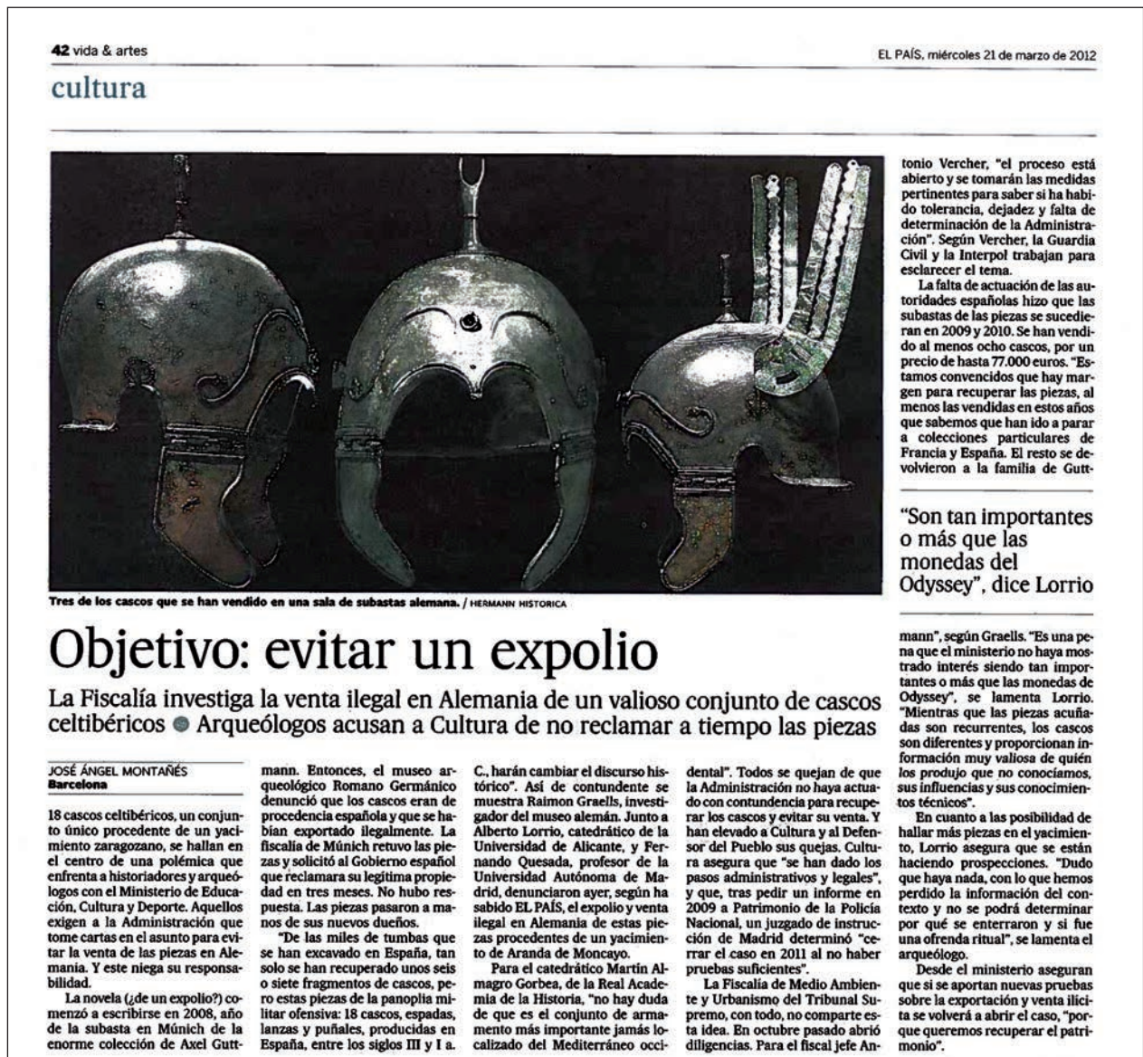
Fig. 5. Página 42 de El País con noticia de J.A. Montañés referente a la necesidad de actuar para la recuperación de los cascos de Aranda de Moncayo (21 de marzo de 2012).